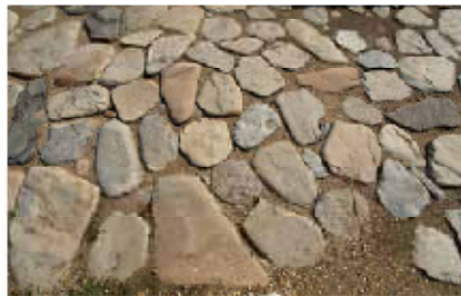
Image de l'ensemble des constructions en pierre de la Via Romana. Les pierres sont en calcaire de la région de Bavay.

Le livret peut être consulté à partir de n'importe quel tronçon de la voie. La traversée intégrale du territoire des Nerviens n'est pas obligatoire en une journée. Les Nerviens eux-mêmes auraient mis 3 à 4 jours pour effectuer un tel déplacement.