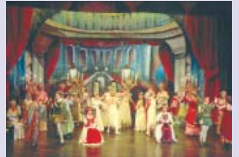
Les Matelots de la Dendre dans leur dernier spectacle présenté en mars dernier.