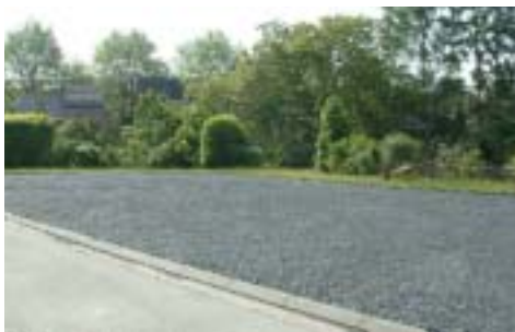
Le parking provisoire qui se trouve à l'arrière de la rue Jean Jaurès.

L'Esplanade arbore peu à peu son nouveau visage. Le parking est maintenant couvert, et les nouveaux arbres sont plantés. Les travaux d'aménagement des trottoirs, zones de stationnement et voiries ont débuté le 3 mai et seront vraisemblablement terminés pour le 15 août. Durant cette période, tout sera mis en œuvre pour faciliter le stationnement et l'accès aux abords de ce chantier.