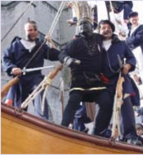
La ducasse était, à l'origine, une fête religieuse célébrant la consécration de l'église Saint-Julien. Déjà au XV e siècle, une procession présentait des scènes religieuses et laïques destinées à l'édification des fidèles et à l'amusement du public. Le défilé, laïque depuis 1819, attire chaque année, plusieurs milliers de spectateurs.

Champ de foire sur la Grand-Place, au Quai St-Jacques, au Marché aux Toiles