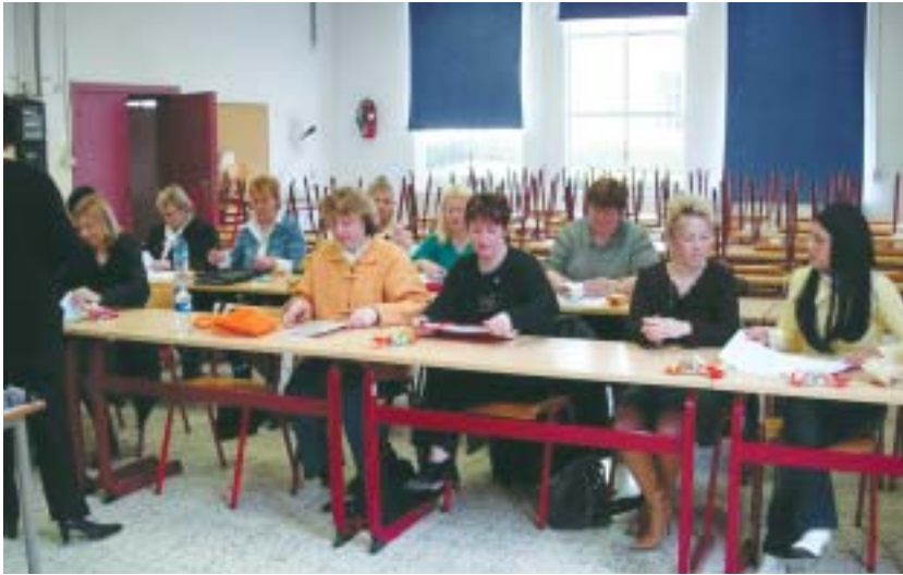
Un groupe de prestataires ALE, récemment en formation.

Porteur de considération sociale, d'identité et de sécurité, le travail est aussi acte de participation à l'utilité sociale et à l'échange économique. Il est, même contraignant, créateur de réseaux et de relations. Mais, tout comme la plupart des pays d'Europe, la Belgique connaît depuis plus de trente ans un taux de sans-emploi choquant et inquiétant. Les moins chanceux, les moins formés, les moins jeunes, les moins performants, les moins en bonne santé, les moins quelque chose – et il y en aura toujours ! – restent sur le côté. C'est comme si la société postindustrielle voulait se réserver un gros matelas de réserve permanente de main d'œuvre inemployée.