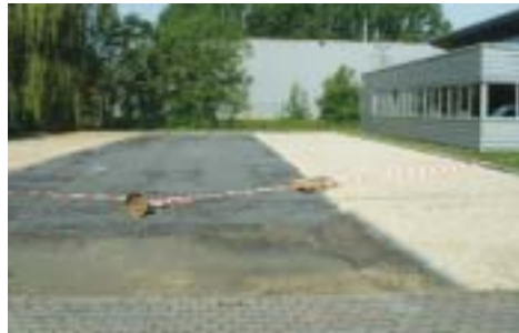
Le parking du personnel du RHMS à la rue des Lilas, et celui du personnel de la SWDE.

Au Chemin des Lilas, sur le site de la SWDE, le personnel du RHMS bénéficiera bientôt d'une aire de stationnement comptant environ 70 emplacements. Le parking sera éclairé et son accès contrôlé. La fin des travaux est prévue vers la fin juin et les emplacements disponibles dans le courant du mois de juillet. Grâce à une étroite collaboration entre la SWDE, le RHMS et la Ville d'Ath, cette opération permettra de libérer des emplacements le long des boulevards et rues avoisinant le site de l'Hôpital et des Maisons de retraite.