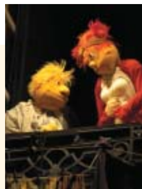
LES UNES FOIS D'UN SOIR