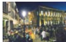
La nocturne d'été au Quartier St-Julien.

Concours public de déclamation. Château Burbant. Org.: Académie de musique, 068/84.14.37.