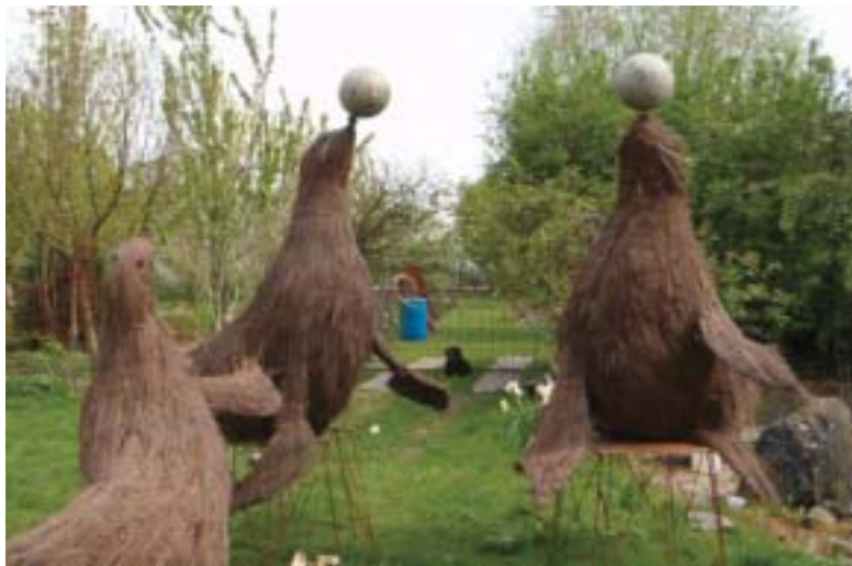
Pendant la construction des structures de base pour «Le cirque» des Florales athoises. C'est là tout un travail mais aussi tout un art !