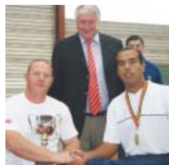
Les finalistes Messieurs 2005 avec le président de l'Association Francophone de Tennis.

L'édition 2005 a accueilli soixante joueurs et joueuses de 10 nations dont un Chilien. Elle a vu la 3 ème joueuse mondiale et le 9 ème mondial triompher. Le tableau principal Messieurs était composé uniquement de joueurs du Top 100 mondial, c'est dire le niveau et la qualité d'un tel tournoi. Celui-ci se veut la vitrine d'un handisport et c'est la raison pour laquelle y est prévue, les trois premiers après-midis, la découverte du tennis en fauteuil : raquettes, fauteuils, balles et moniteur sont mis à disposition gratuite par le comité d'organisation dans lequel on retrouve notamment tous les services-clubs de la région ainsi que de la Jeune Chambre Economique. Voilà une belle image de notre ville, alliant solidarité et intégration de la personne à mobilité réduite ! Info : 068/28.54.89 , athopen@yahoo.fr , www.rtcath.be .