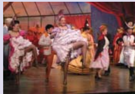
Les Matelots de la Dendre dans leur dernier spectacle présenté en mars dernier.