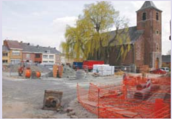
Eh oui, le vaste chantier qui concerne les Rues du 7 Juillet, Jean Watrin, de la Poterie, la Place et l'ouverture de la Rue d'Ardenne, est lancé.

La Place est conçue pour accueillir les joutes ballantes et, autour de l'Eglise, un beau jardin composé de plantes qui fleu-