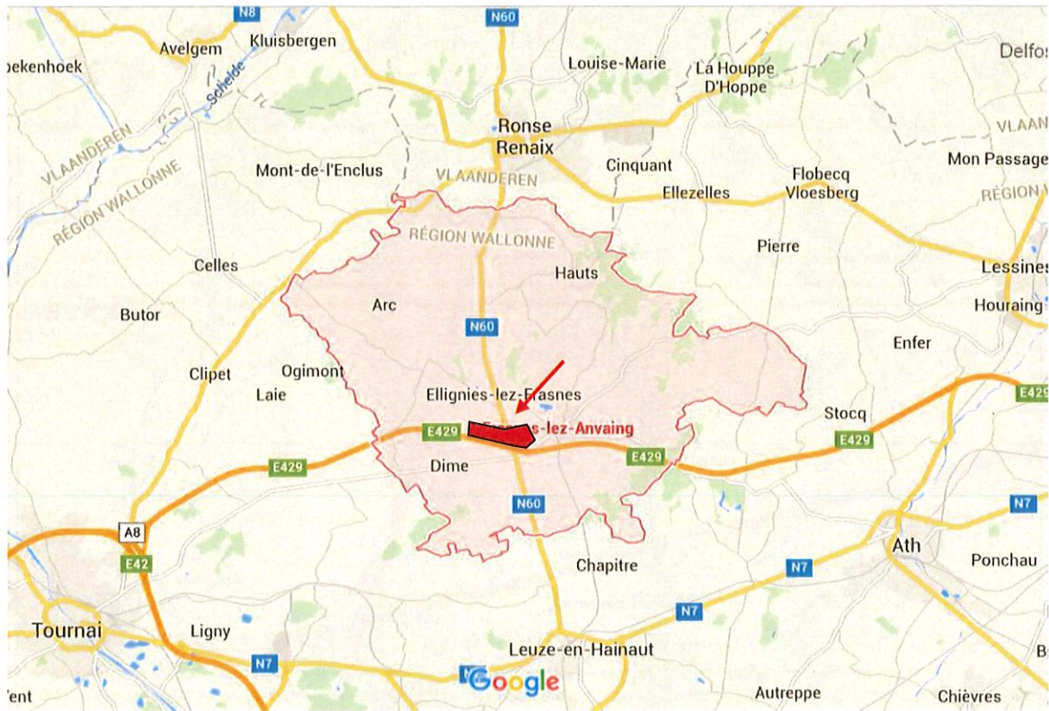
Figure 1 : Localisation du site sur la carte routière

Au plan de secteur, le site est inscrit en zone agricole (voir planche 2 du volume 2 de l'EIE).