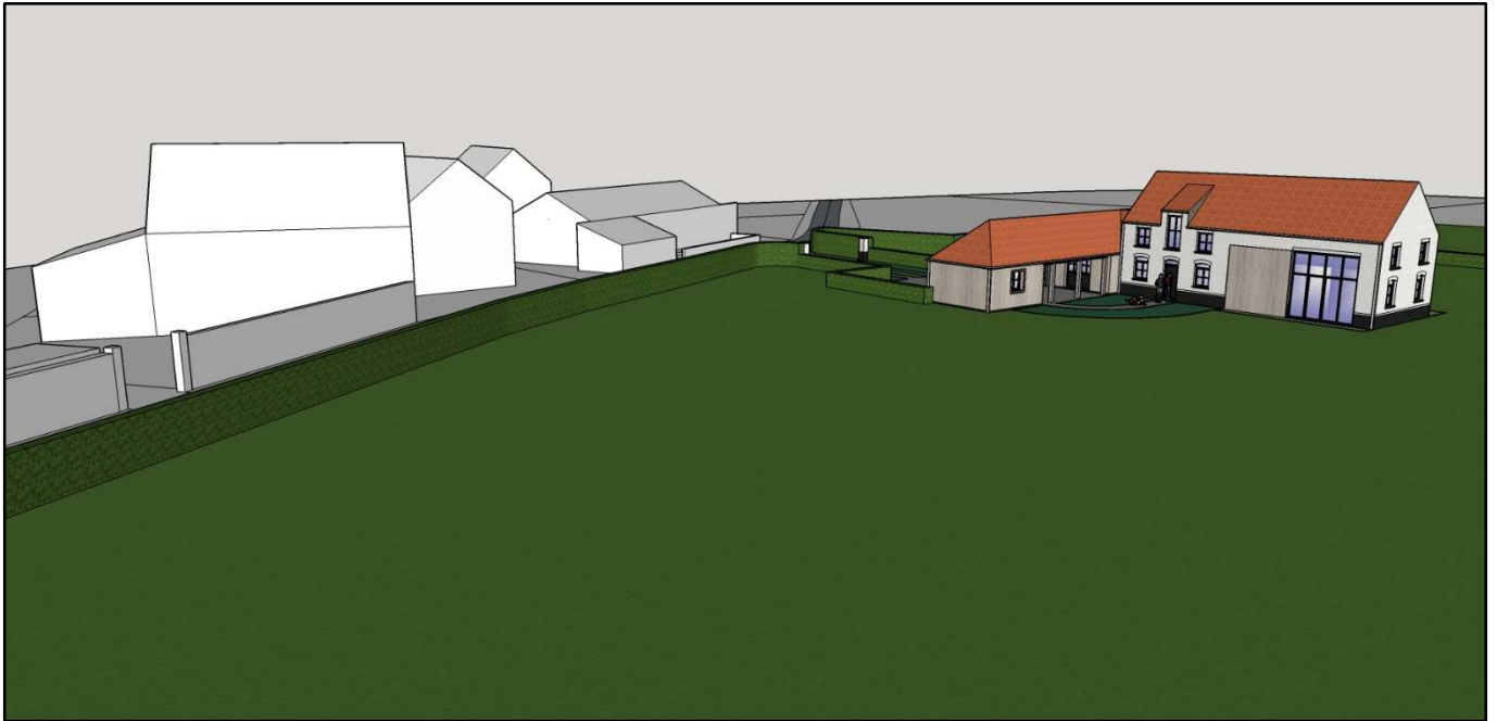
Contexte urbanistique et paysager en 3D n°3