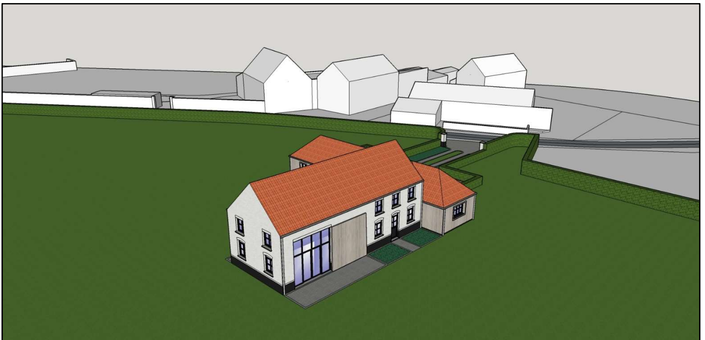
Contexte urbanistique et paysager en 3D n°2