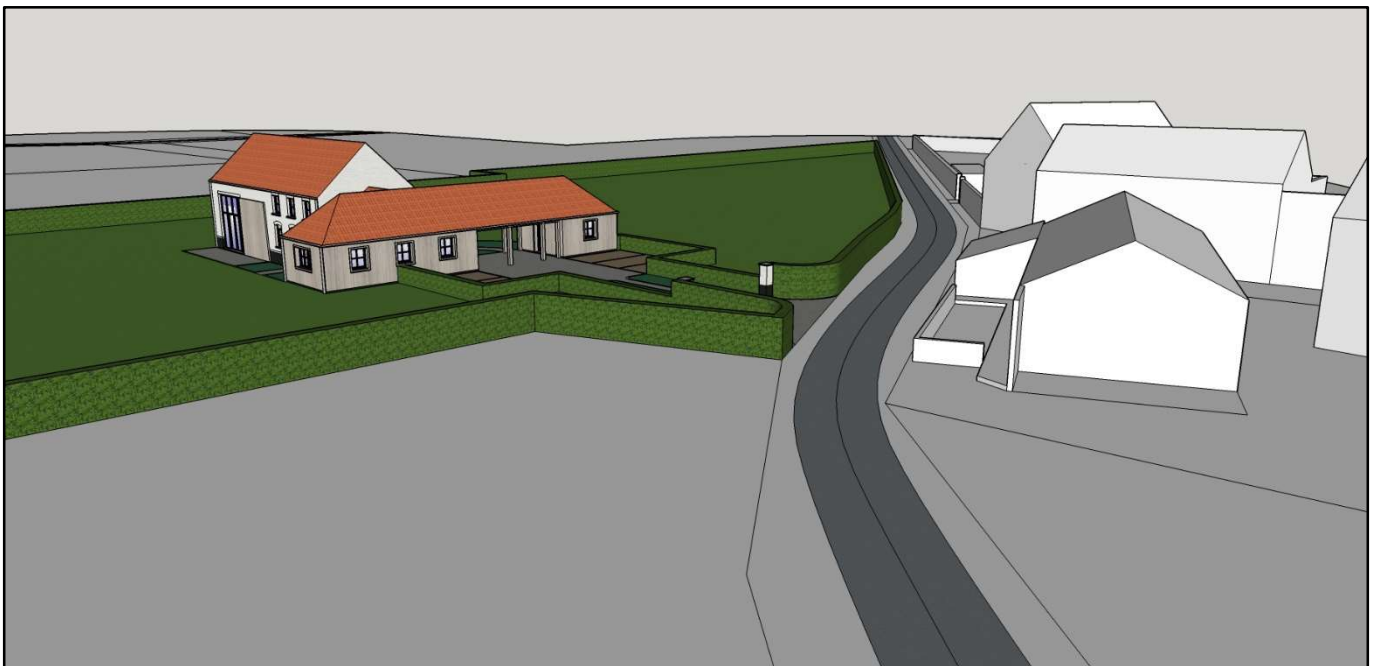
Contexte urbanistique et paysager en 3D n°4