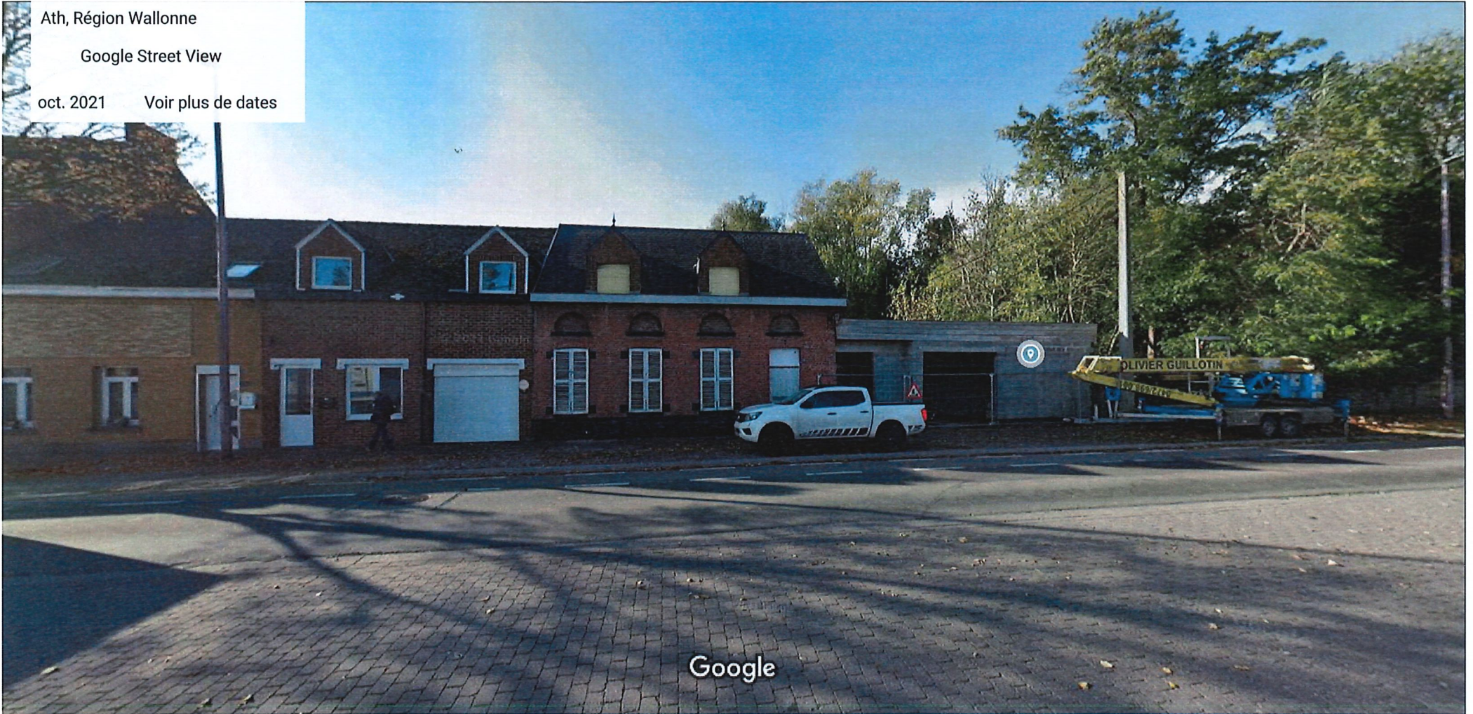
Date de l'image : oct. 2021

Ath, Région Wallonne Google Street View oct. 2021 Voir plus de dates